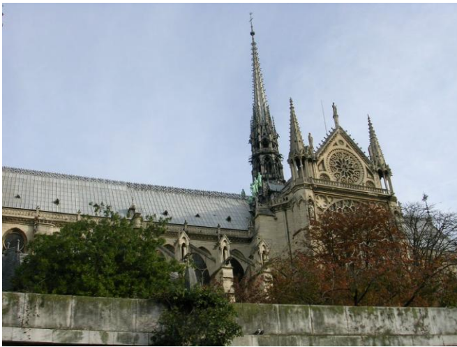
Notre Dame - Paris