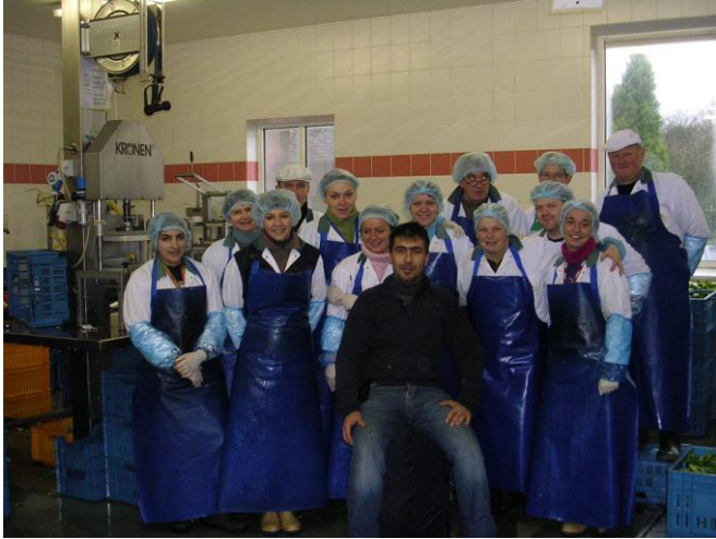
Vsi delavci v podjetju 1