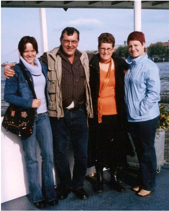
Najin prosti dan na ladji v Rotterdamu