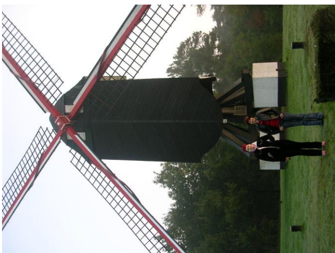
Mlin na veter v Belgiji