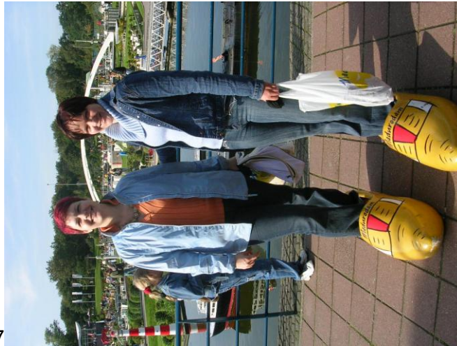
Šentjur, januar 2007