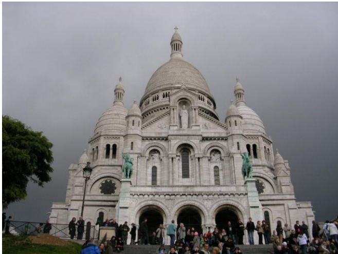
Joie de Vivre- Paris