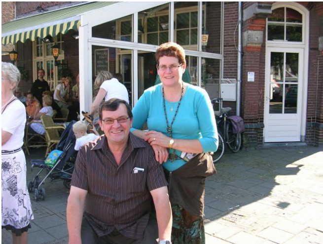
Šef in šefica- gostitelja