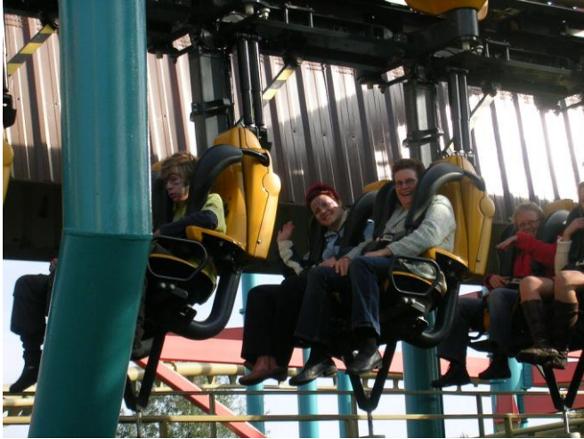
Bobbejaanland v Belgiji zabavišni park