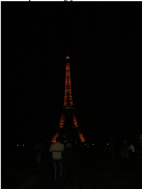
Eiffeltoren - Paris