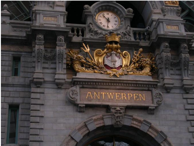
Antwerpen v Belgiji