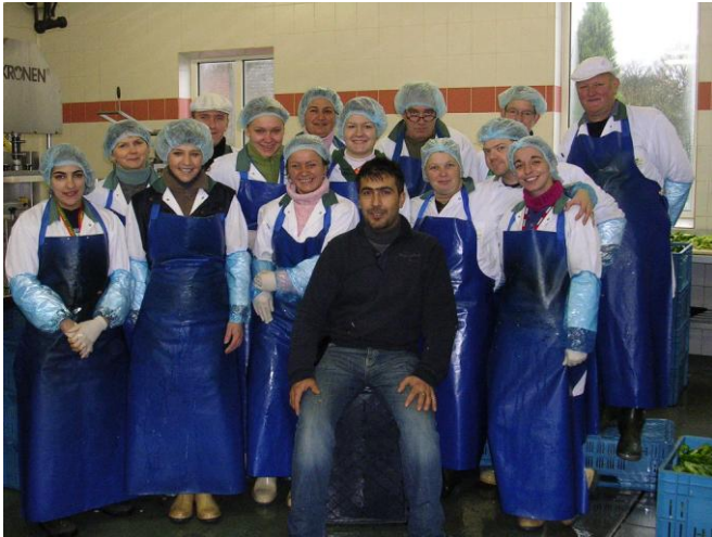
Vsi delavci v podjetju 2