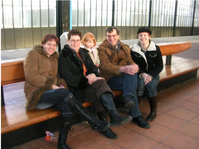
Zadnji da na železniški postaji - Eindhoven