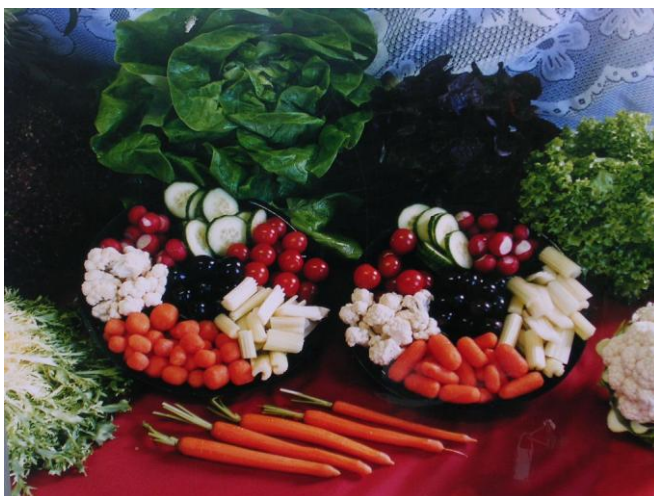
Pripravljena zelenjava v industriji