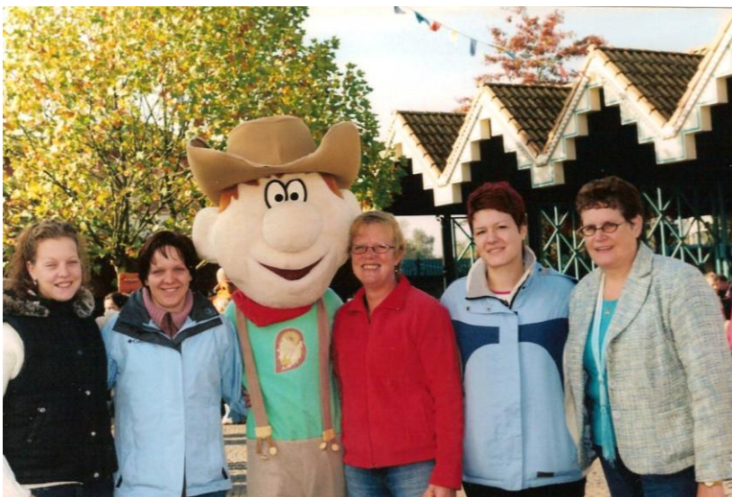
Najin prosti dan v zabaviščnem parku Bobbejaanland