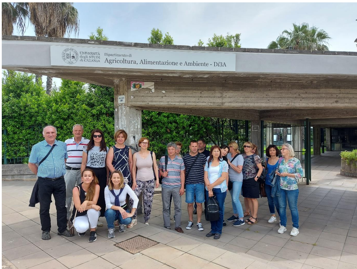
Ogled Catanie (naravna in kulturna dediščina, zgodovina, turizem, gospodarstvo, izobraževanje, kulinarska dediščina itd.)