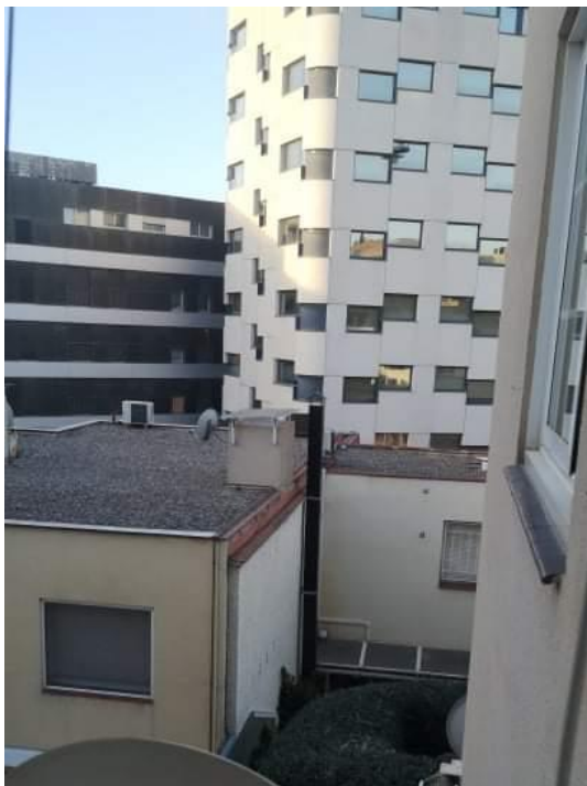
pogled z okna