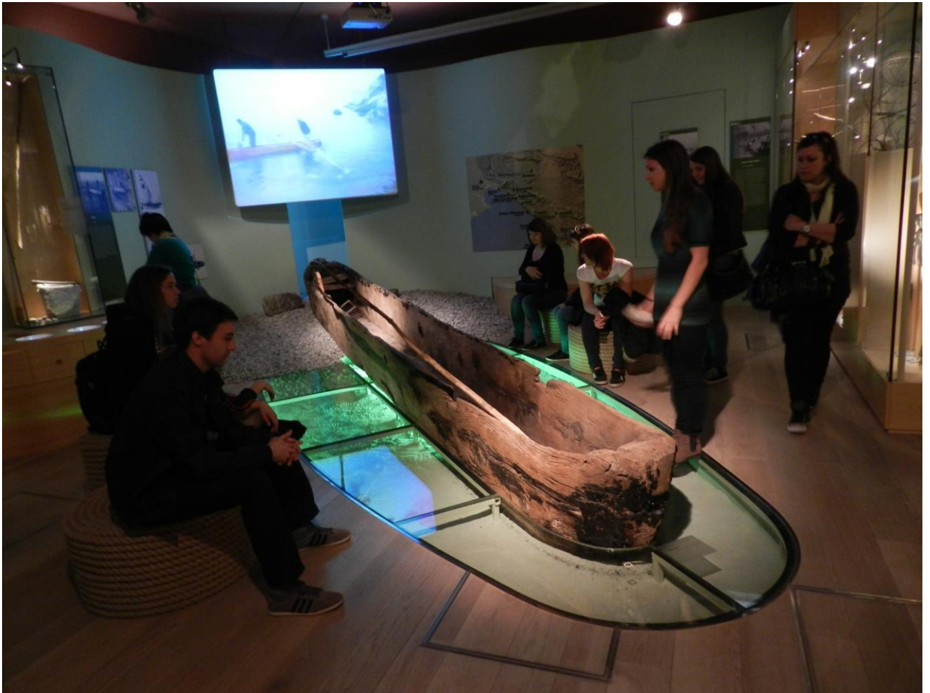
Vpogled v našo bogato preteklost