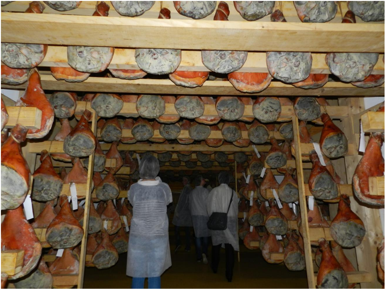
Med sprehodom po pršutarni