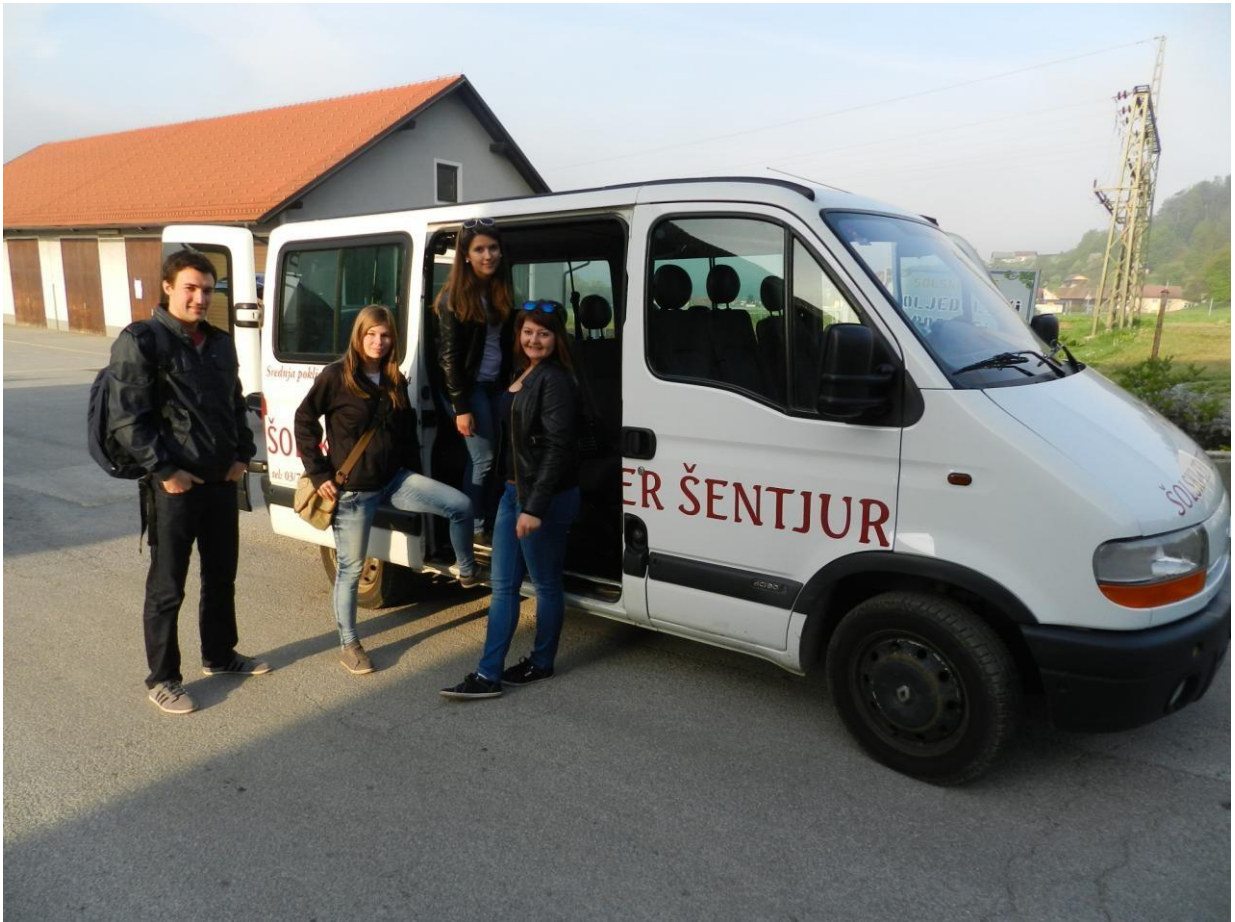
V nestrpnem pričakovanju pred pričetkom ekskurzije