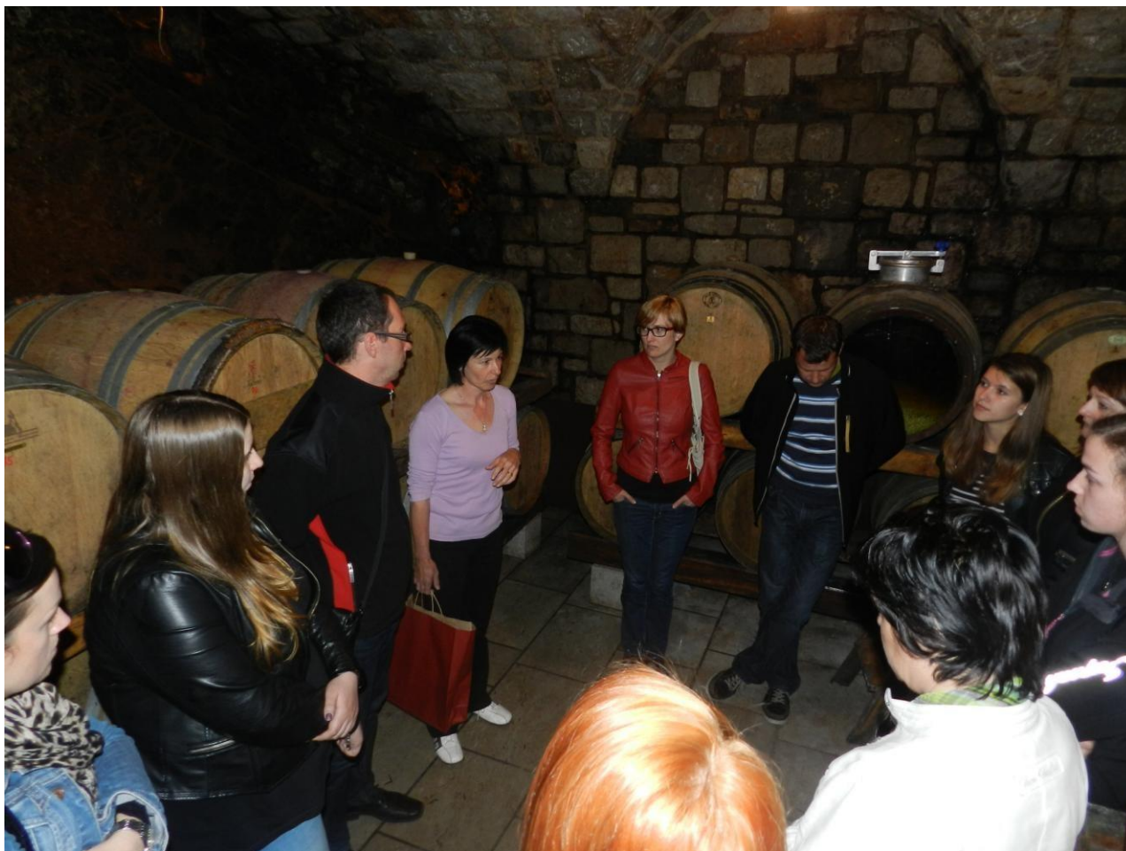
Med uro vinarstva na terenu

Študentki višješolskega programa Gostinstvo in turizem