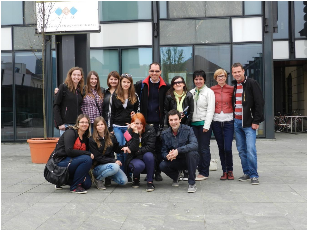
Pred etnografskim muzejem