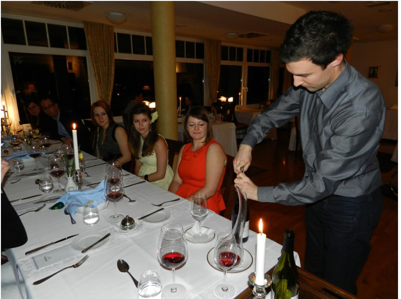
Med večerjo študenti nismo le uživali ampak tudi delali